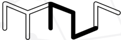
MUSEU DE ARTE DO RIO